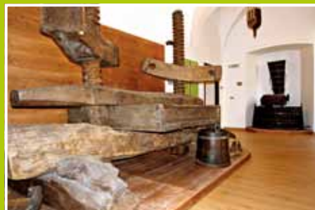
la vendemmia e la lavorazione del vino