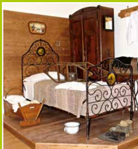
gli ambienti domestici