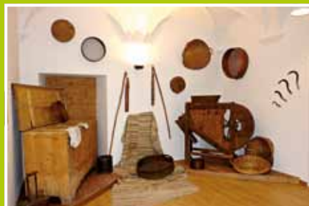
la mietitura e la trebbiatura