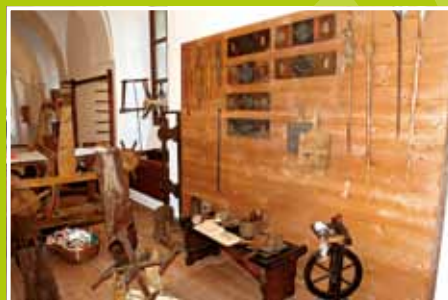
la filatura e la tessitura