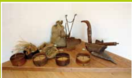
la preparazione e la semina dei campi