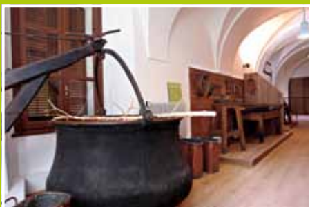
Incontriamo tra gli altri: la lavorazione del latte

L'itinerario museale ci racconta attraverso le sue collezioni momenti di vita contadina sia nei campi sia negli ambienti domestici, nell'arco dei mesi.