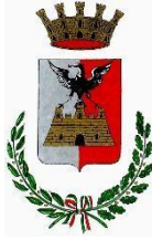
COMUNE DI TIRANO