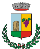
COMUNE DI POGGIRIDENTI