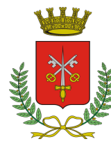
COMUNE DI MORBEGNO