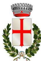
COMUNE DI CHIURO