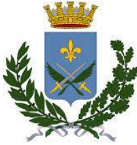
COMUNE DI SONDRIO