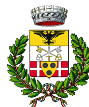
COMUNE DI TRESIVIO