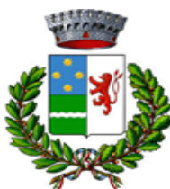
COMUNE DI PIATEDA