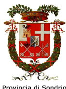
Provincia di Sondrio